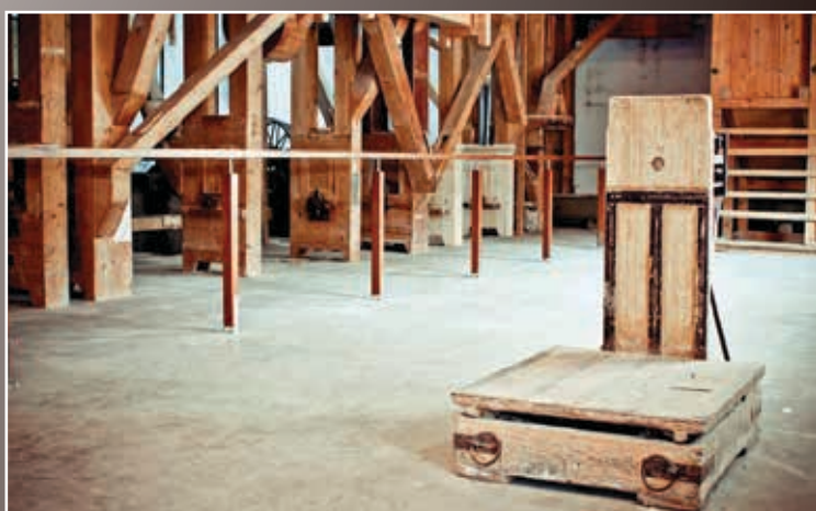
Dujkov mlyn interiér