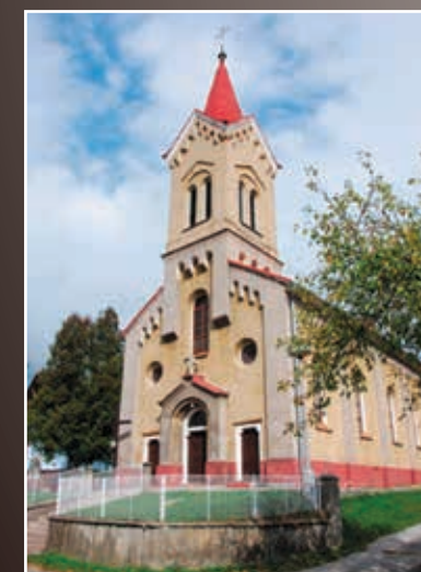
Kostol sv. Cyrila a Metoda