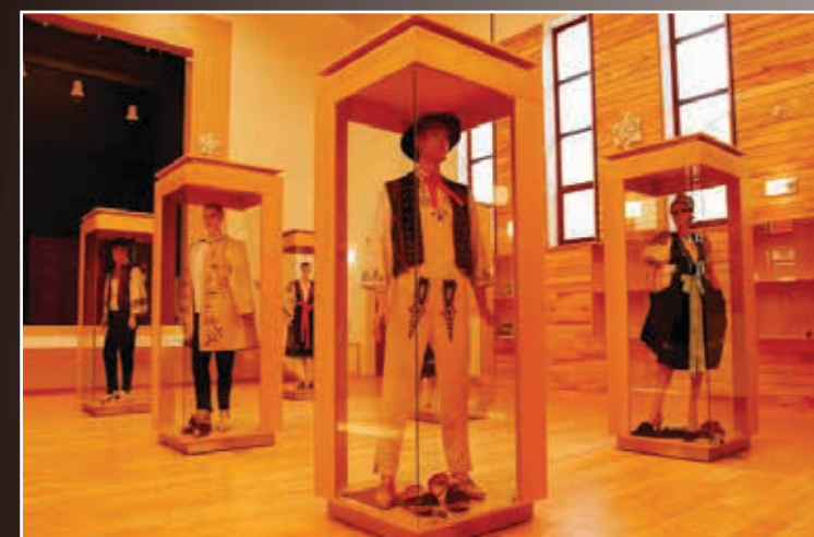
Stála expozícia krojov v Dome kultúrnych tradícií